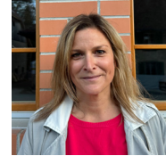
Cécile Stucki Stiglimattstrasse 37 3250 Lyss Administration