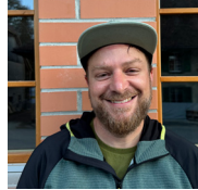
Severin Studer Rebenweg 9 3235 Erlach Logistik